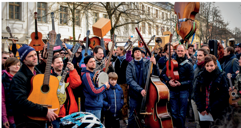
© Kristina Tschesch 2014 / Protest für Freiräume