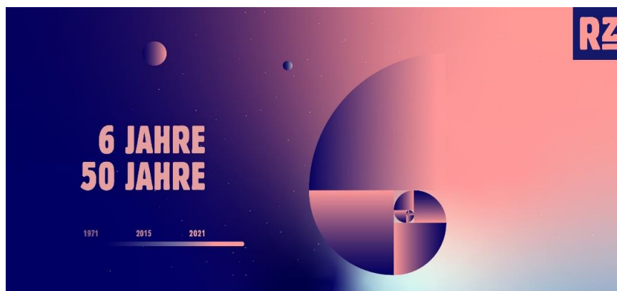
Gestaltung: Viola von Zadow

Vor Ort gelten die aktuellen Covid-Eindämmungsregeln. Bei Besuch der Ausstellungen und Performances ist ein Nachweis von Impfung, Genesung oder aktuellem negativen Test nötig.