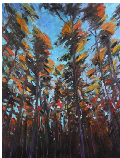
„Kiefernwald V“ von Jasper Precht