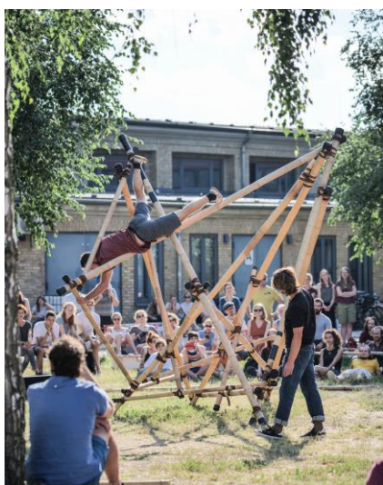
„101 concrete“

Kunst- und Kreativhaus Rechenzentrum Dortustr. 46 14467 Potsdam