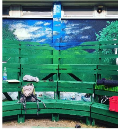
Ausschnitt Wandgemälde, Artchurch.me