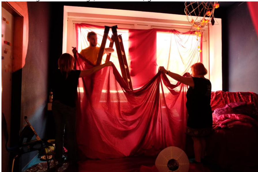
Ehemaliger Verwaltungsflur wird zur Theaterkulisse.

Seit einer knappen Woche gehen junge Schauspielerinnen und Theatermachende im Rechenzentrum ein und aus. Sie verwandeln Büroräume, Kosmos und Innenhof in märchenhafte sowie verwirrende Kulissen für ihre neueste Produktion „IRRtum – Institut für Re-Realisierung, Täuschung und Magie“. Von Freitag bis Sonntag, 1. bis 3. Juni kann das Publikum an vier Aufführungen dieses Institut betreten und eigene Wünsche einbringen- wenn alle Formalitäten erfüllt sind. Für die Aufführungen am Samstag (18 und 21 Uhr) gibt es noch Karten.