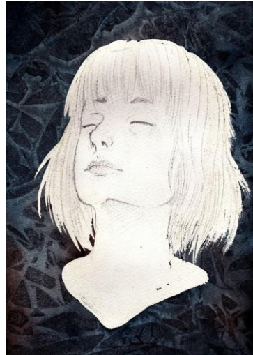
Lisa Steinbrück, „Selbst in Blau“ (2015) Graphit, Aquarell

Auf die liebevolle Begegnung freuen sich folgende Ausstellende: